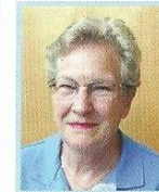
6. Ulla Stark